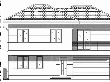
A POŁUDNIOWO-WSCHODNIA - FRONT