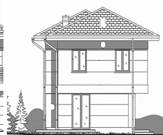
C:JA PÓLNOCNNO - WSCHODNIA BOC: